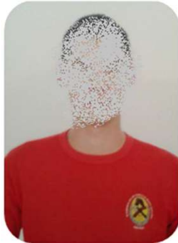
FIGURA 2 – MODELO DE FOTO

3.2.1 A foto deve ser no formato 3x4, padrão para documento, com fundo branco e de camiseta vermelha de malha, com gola redonda, na qual deverá aparecer o brasão da ABVESC, conforme figura 2.