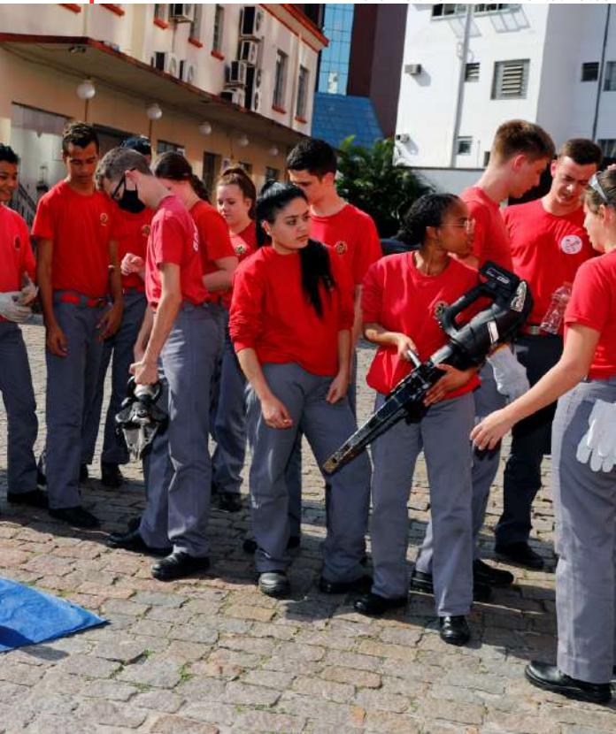
André Hellmann/Continental Fotos